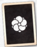
Carte Premier joueur (recto verso)