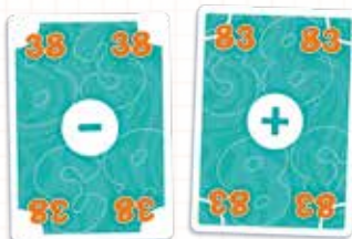
38 est la carte Miroir de 83. Et vice versa !